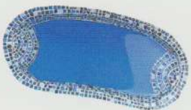
swimming pool piscină