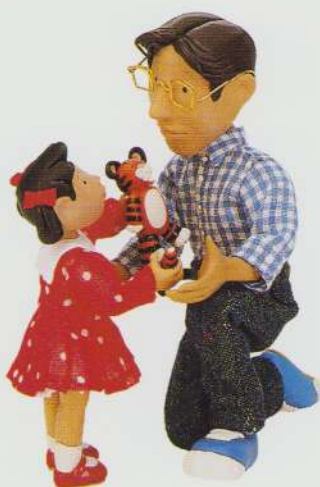
daughter fiică father tată