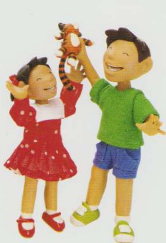
sister soră brother frate