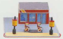
petrol station benzinărie