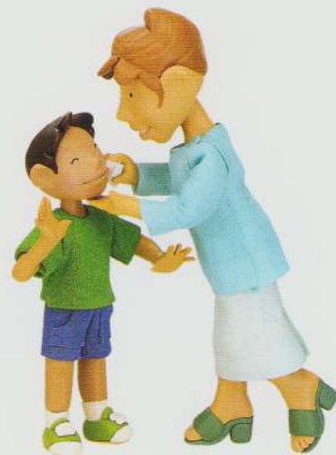
son fiu mother mamă